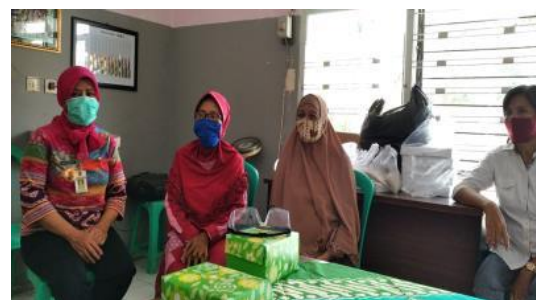
Gambar 4. Pelatihan Pemasaran Online

Pemasaran oleh mitra sangat dibutuhkan, mengingat salah satu kendala terbesar yang dihadapi mitra adalah pada aspek pemasaran. Hal ini penting, karena ujung tombak dari UMKM adalah memasarkan produk. Tujuan dari kegiatan ini adalah mitra dapat melakukan analisis potensi – potensi konsumen mereka dan strategi – strategi yang dapat dilakukan untuk memperluas cakupan pangsa pasar. Pemasaran pada hakekatnya adalah suatu komunikasi pemasaran, artinya aktifitas pemasaran yang berusaha menyebarkan informasi, mempengaruhi atau membujuk, dan atau mengingatkan pasar sasaran atas perusahaan dan produknya agar bersedia menerima, membeli dan loyal pada produk yang ditawarkan perusahaan yang bersangkutan (Tjiptono, 2008). Dengan adanya media promosi masyarakat akan lebih mengenal produk bandeng presto ini. Saat ini ada banyak media yang dapat digunakan untuk melakukan pemasaran online. Salah satu yang kami berikan adalah website. Sriyana (2010), menyatakan bahwa penguasaan teknologi merupakan salah satu faktor penting bagi pengembangan usaha kecil menengah.