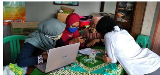
Gambar 3. Pelatihan Pembukuan Sederhana

Pelatihan pembukuan sederhana ini bertujuan untuk meningkatkan ketrampilan dan pengetahuan tentang pembukuan dan memisahkan keuangan pribadi dengan usaha. Serta dapat mengetahui perkembangan usahanya dengan baik dan sistematis. Subur dan Hasyim (2014) mengungkapkan bahwa manajemen keuangan dalam menjalankan sebuah usaha kecil mikro merupakan aspek penting dalam menentukan kesuksesan suatu usaha. Dengan manajemen keuangan yang baik maka akan diperoleh laba yang jelas jumlahnya dan mengambil keputusan yang tepat. Dengan pelatihan pembukuan sederhana diharapkan pelaku usaha kecil dapat mengelola pembukuan keuangan usahanya dengan baik dan sistematis, sehingga dapat menghasilkan laporan keuangan sesuai dengan standar yang berlaku. Selain itu, penerapan pembukuan sederhana juga dapat menciptakan budaya disiplin di dalam menjalankan usaha. Pembukuan keuangan dengan excel dapat membantu pelaku usaha kecil memahami penyajian laporan dalam bentuk graphic, tabel dan sebagainya.