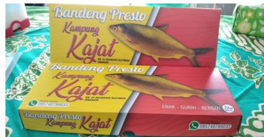
Gambar 6. Kemasan Baru