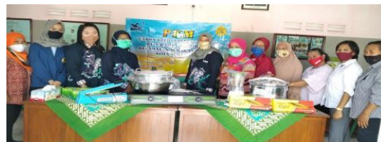
Gambar 1. Foto bersama ibu – ibu warga RW 02 dan Ibu Lurah Mlatibaru penyerahan Alat – alat produksi

Bantuan Peralatan kepada mitra dilakukan dalam rangka untuk meningkatkan produksi dan kualitas bandeng presto . Peralatan yang diberikan sesuai dengan kebutuhan mitra berupa satu buah panci presto ukuran besar, lemari etalase untuk memajang hasil produksi, sealer untuk menghaluskan bumbu, panci dan peralatan pendukung yang lain.