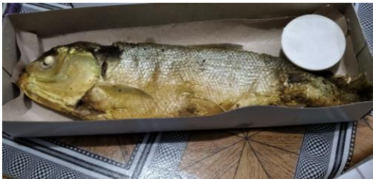
Gambar 7. Bandeng Presto

yang bersifat tahan panas, dan dimasukkan ke dalam kardus.