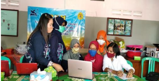
Gambar 2. Pelatihan Membuat laporan keuangan dengan excel

dengan excel ini diberikan dengan harapan mitra mampu membuat laporan keuangan dengan aplikasi microsoft excel. Pembuatan laporan keuangan berfungsi untuk merencanakan keuangan dan mengetahui untung atau rugi usahanya. Sehingga mitra dapat mengetahui perkembangan usahanya.